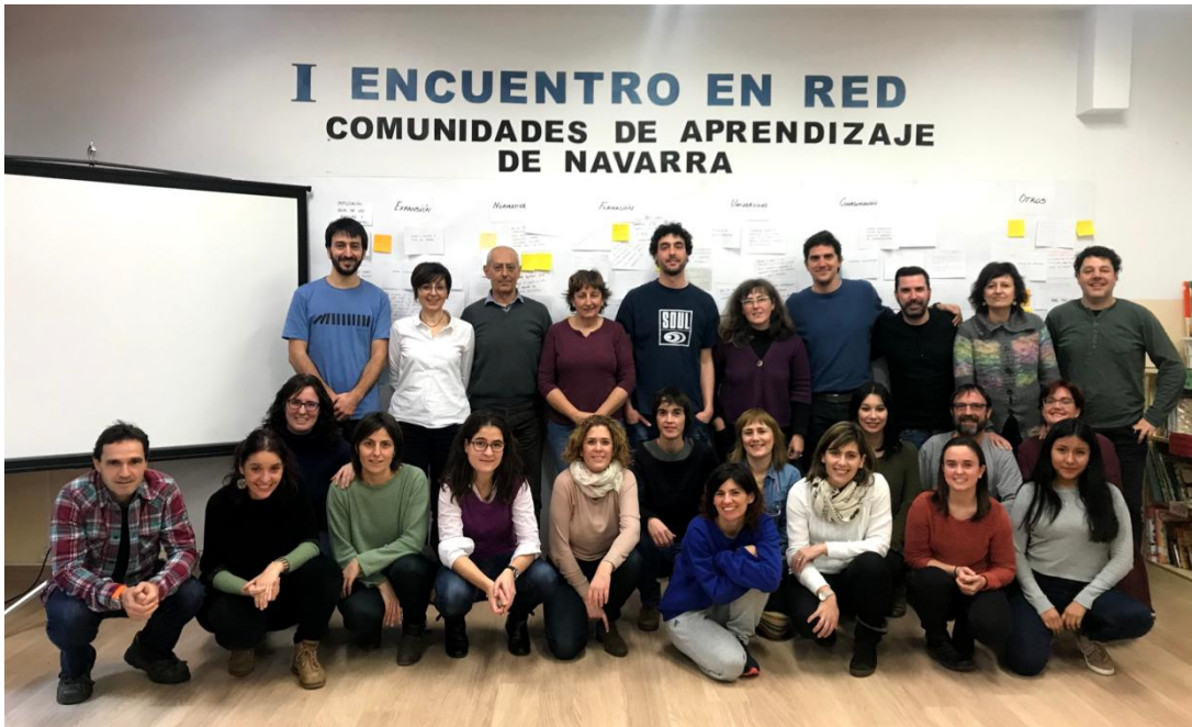
Participantes en la clausura del encuentro del 27 de enero de 2018.

En un ecosistema educativo cada día más deshumanizado y privatizado, en el que progresan las políticas de competición entre escuelas, luchan por mantener el equilibrio de manera autótrofa organismos interescolares como la Red Navarra de Comunidades de Aprendizaje.